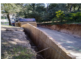
Piste cyclable à Suzac