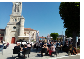
Concerts dès mai