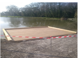
Ponton à Enlias